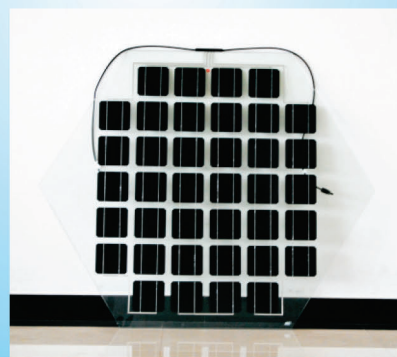
六边形BIPV构件 型号 : DBF(LBX)100