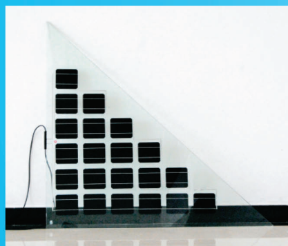
三角形BIPV构件 型号 : DBF(SJX)60